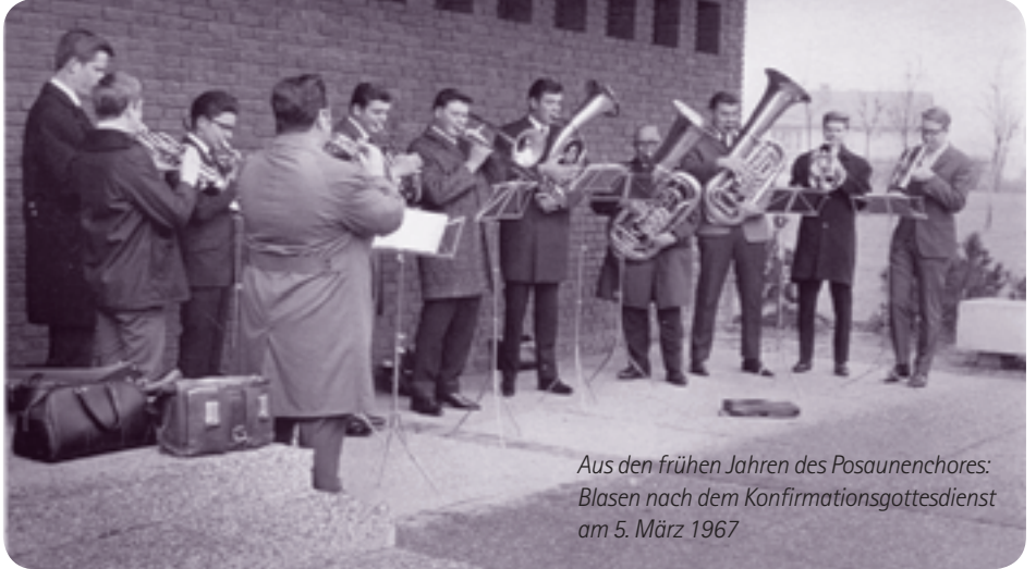
Aus den frühen Jahren des Posaunenchores: Blasen nach dem Konfirmationsgottesdienst am 5. März 1967