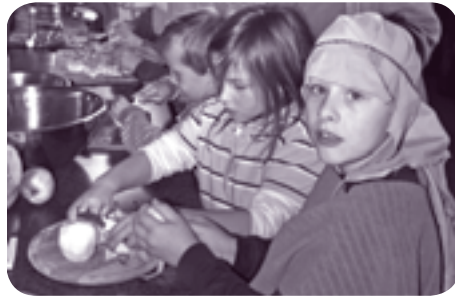
Fröhliche Kinder bei der Kinder-Bibel-Woche